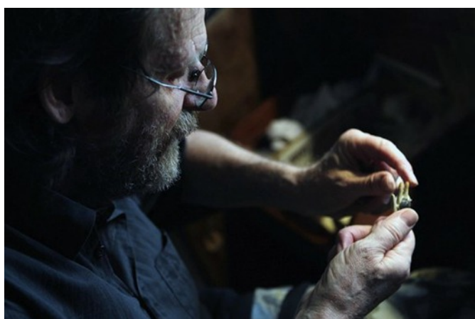
Vnitřní výztuži těla bývá obvykle kovový drátek, který umožňuje loutce pohyblivost. Často se používají prvky jako hliník nebo olovo, jelikož s latexem nijak nereagují. Jiné kovy by se s ním nesnesly.