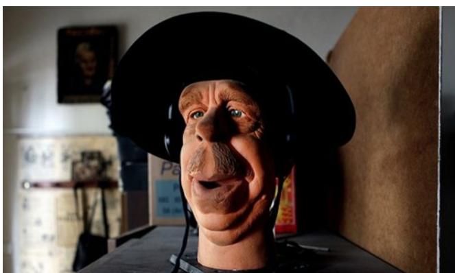
Možná si ještě vzpomenete na gumového Václava Havla z pořadu Gumáci

o tenhle typ řemeslné práce v kinematografii bohužel stále menší zájem. Pomalu ale jistě se stává nepotřebnou a jednoho dne bude patrně zcela zapomenuta. Řekněte sami, není to škoda?