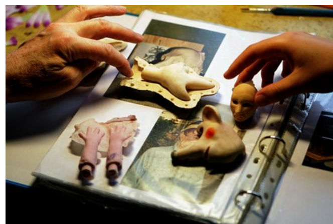
Po odlití do sádrové formy se latex zapeče v peci při teplotě přibližně 100 °C