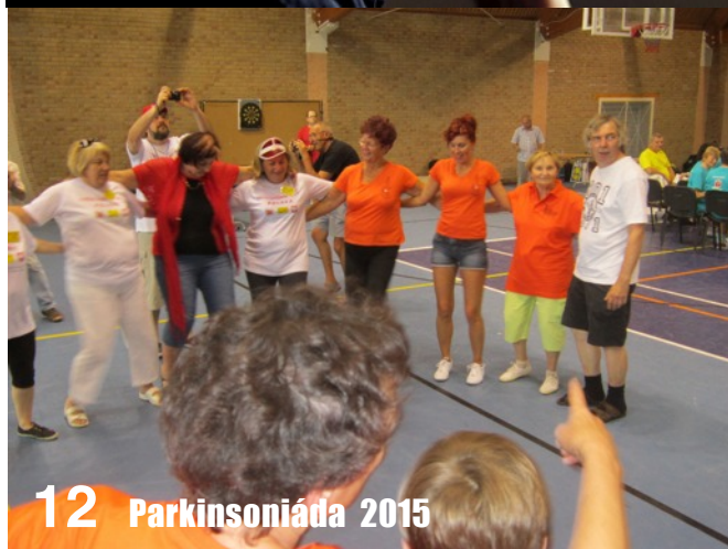
12 Parkinsoniáda 2015