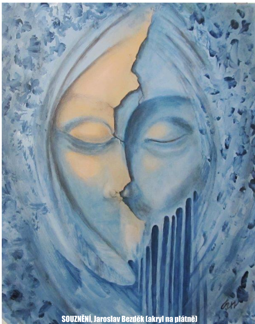
SOUZNĚNÍ, Jaroslav Bezděk (akryl na plátně)