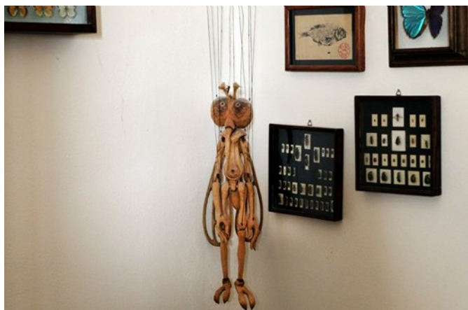
Nad kanapem v mistrově ateliéru