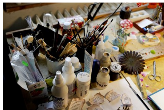
Bez správného ateliérového zátíší se tento netradiční typ práce neobejde

Někdy se kvůli následné animaci, při které je třeba zachytit všechnu důležitou mimiku a pohyby, musí vyrobit více segmentů loutky; ty se pak během natáčení různě vyměňují. Záleží na tom, jak moc