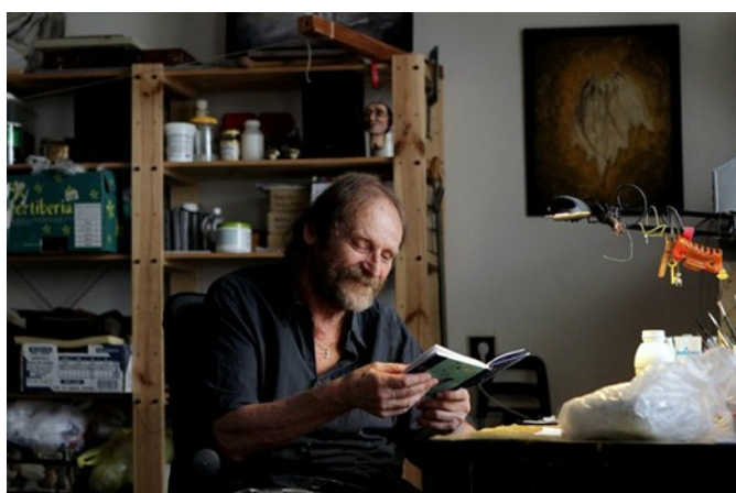
Důležité je dostat dobře zpracovaný výtvarný návrh loutky. Občas se ale stává, že se řemeslník musí spokojit i se základní kresbou na kousku novin.

Někdy se kvůli následné animaci, při které je třeba zachytit všechnu důležitou mimiku a pohyby, musí vyrobit více segmentů loutky; ty se pak během natáčení různě vyměňují. Záleží na tom, jak moc