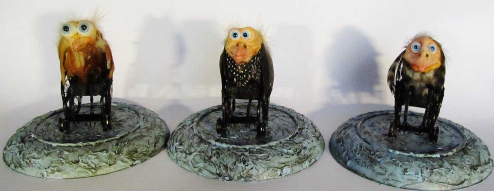
Ptačinec Jaroslava Bezděka