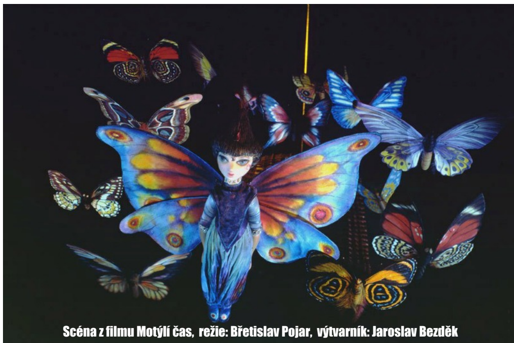
Scéna z filmu Motýlí čas , režie: Břetislav Pojar, výtvarník: Jaroslav Bezděk

Vzpomínáš, jak jsi na rekondici ve Skokovech slavila šedesáté narozeniny? Bylo teplé jaro, spolu s námi byli v penzionu ubytovaní cyklisté. Prima krásní chlapi. Když se dozvěděli, že slavíš narozky, posbírali dřevo na táborák, koupili Ti kytku a šampaňské. Byl to krásný večer.