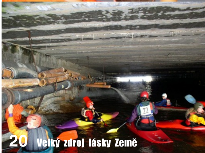
20 Velký zdroj lásky Země