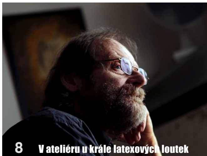
8 V ateliéru u krále latexových loutek